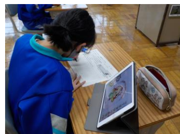
タブレットを活用した学習

お子さん一人ひとりに、帰宅してからの予定を聞き、時間が合うタイミングで接続テストを行いました。教室の黒板前では、担任が自分のタブレットに映る子どもたちに声を掛けながら繋がりを確認していました。「先生の声が聞こえたら、スタンプを押してみてください」「チャットを使ってメッセージを送ってみて」など、操作方法についてもチャレンジしました。